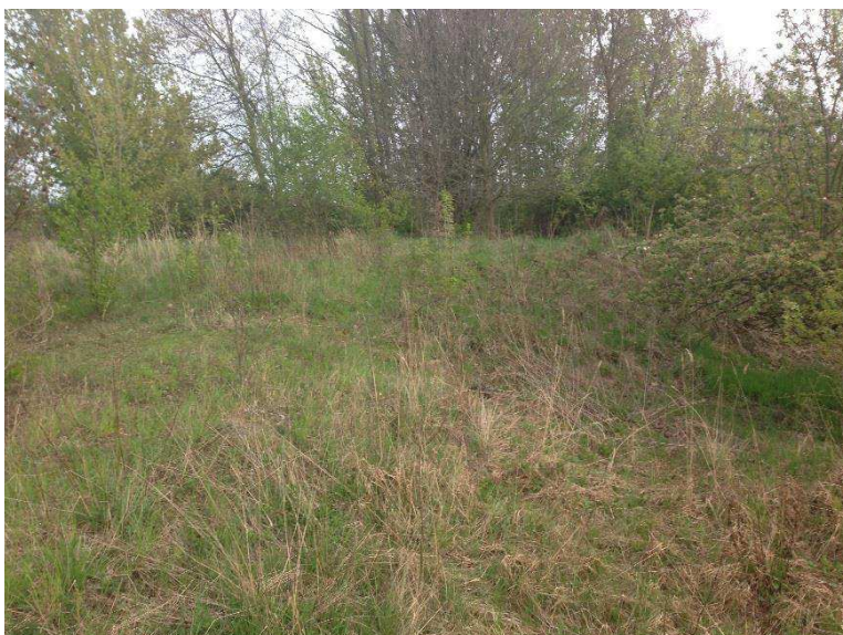
Foto 3: Ruderalfläche 150 m nordwestlich des Untersu- chungsraumes